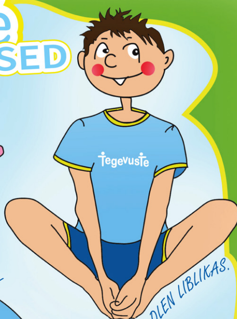
MINA OLEN LIBLIKAS.