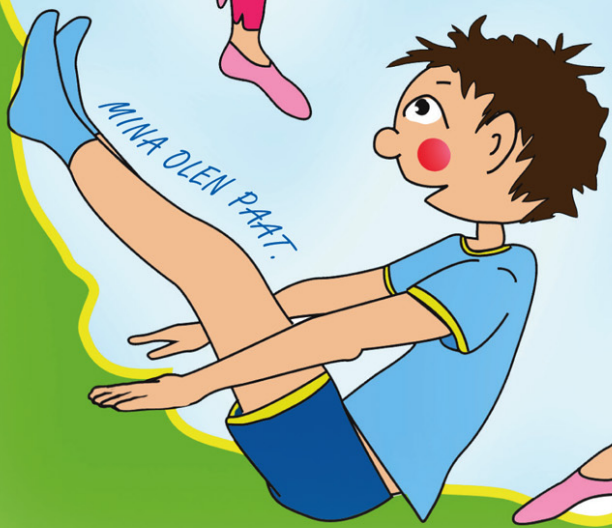
MINA OLEN PAAT.