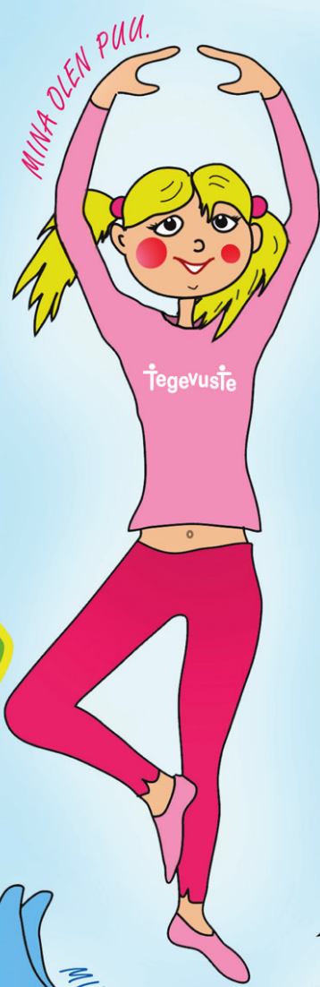
MINA OLEN PUU.