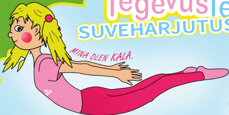
MINA OLEN KALA.